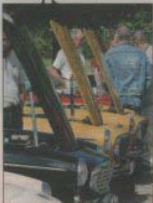
Uppställning. Heigonbilarna visade vad som döljer sig under huven.