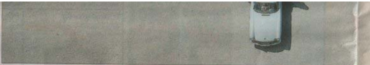
46 skönheter. Änglalika sådana uppställda vid Ängsö slott. Volvo P1800-klubben firade 25-årsjubileum med en bilarmada.