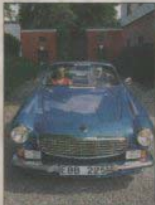
Enda caben. Volvo P1800 tillverkades aldrig i cabrioletmodell, men den här har byggts om till en öppen bil.