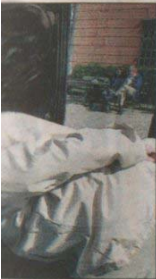
...ar skinande ren.