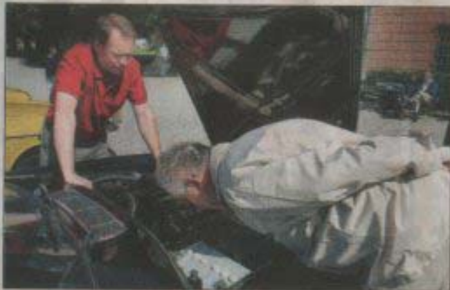
Inspektion. Varendra mutter och skruv var skinande ren.