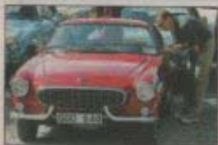
Kolla in. Många bilentusiaster fick något lystet i blicken.