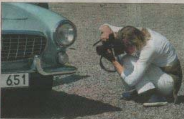
Förevigad. Konkurrerande blaskas utsända speglar sig i glansen.